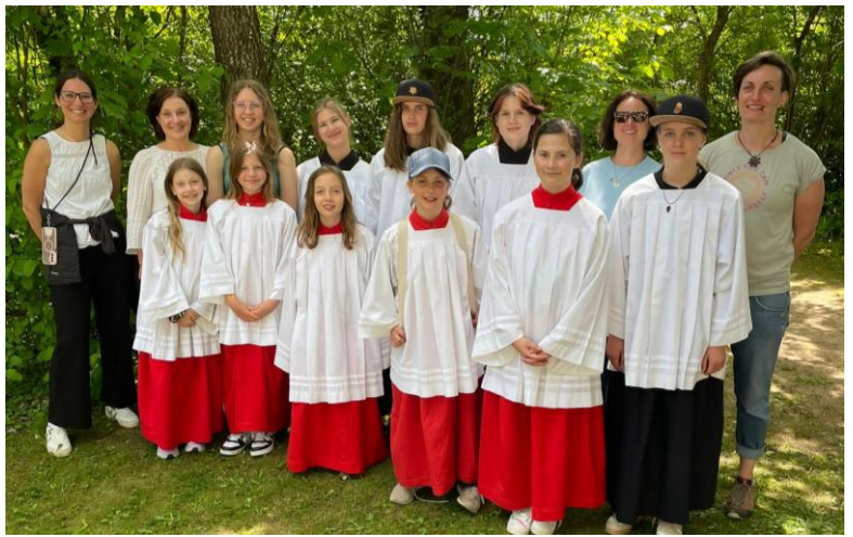
Text und Bilder: Wertacher Ministrantengruppe

großer Zug mit allen 2100 Ministrantinnen und Ministranten statt, der zum gemeinsamen Gottesdienst führte. Die große Gemeinschaft und die Stimmung waren beeindruckend. Zum Abschluss des Tages gab es noch ein Konzert der Band „it Hudla“. Mit ihrer Musik sorgte die Band für einen tollen Abschluss des Minitags. Insgesamt waren beide Veranstaltungen sehr schön und haben allen Beteiligten viel Freude bereitet.