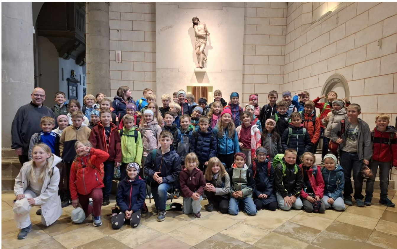
Unsere Erstkommunionkinder im Augsburger Dom.

Am Donnerstag, den 07. Mai 2026 fuhren die Kommunionkinder der Pfarreiengemeinschaft zum gemeinsamen Ausflug nach Augsburg. Nach der gemeinsamen Hl. Messe, die wir mit unserem Pfarrer P. Athanasius im Hohen Dom feierten, ging es in der Bischofskirche noch auf Entdeckungstour, bevor wir dann dem Augsburger Zoo besuchten. Die Stimmung ließen wir uns von dem regnerischen Wetter nicht vermiesen! Vielen lieben Dank an alle, die uns an diesem Tag begleitet haben!